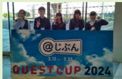
■クエストカップ2024 全国大会出場