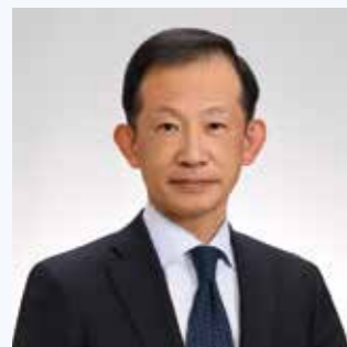
学校法人山崎学園 理事長 磐城緑蔭中学校・高等学校 校長