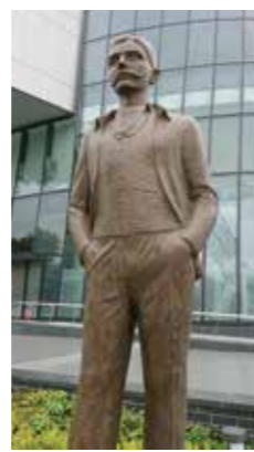
作品名：ピエール・ド・クーベルタン

また、2019年には東京オリンピックに向けた新施設 Japan Sport Olympic Square内の「クーベルタン像」を制作するなど、国内外に活躍の場を広げています。