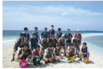
7月 ▶ 修学旅行(高2)・校内競技大会 夏季課外