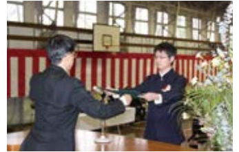
3月 卒業式・春季課外 学習合宿