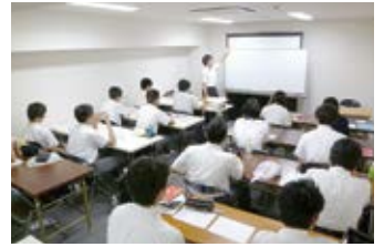
8月 ▶ 9月 ▶ 学習合宿 夏季課外 学校開放週間