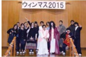
12月 ▶ 芸術鑑賞会・ウインマス 冬季課外