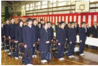
4月 ▶ 入学式・対面式 部活動紹介・面接週間