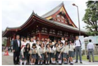
5月 ▶ 6月 ▶ 生徒会総会 学校開放週間 遠足(高1)・進路講演会