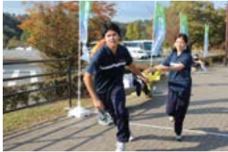
10月 ▶ 11月 ▶ 防災訓練 校内駅伝大会 面接週間