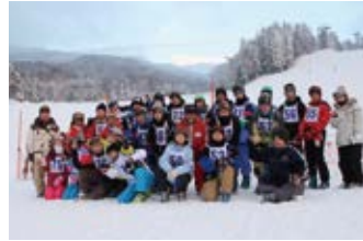
1月 ▶ 2月 ▶ スキー教室